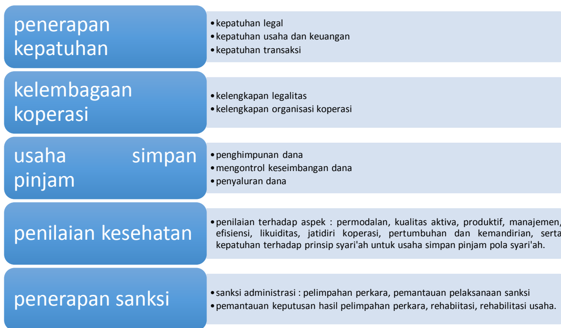
Gambar 4.2.Ruang Lingkup Pengawasan Koperasi

Sebagai badan hukum, koperasi terikat untuk tunduk kepada aturan perundangan yang ada. sebagaimana kita ketahui, aturan perundangan tersebut bisa yang berasal dari luar koperasi (eksternal) yang biasa kita sebut sebagai hukum publik, atau yang berasal dari dalam koperasi (internal) yang biasa kita sebut sebagai hukum privat. Koperasi sebagai "self regulating body" bisa membuat aturan untuk dirinya sendiri dalam rangka menjalankan operasinya sebagai badan usaha.