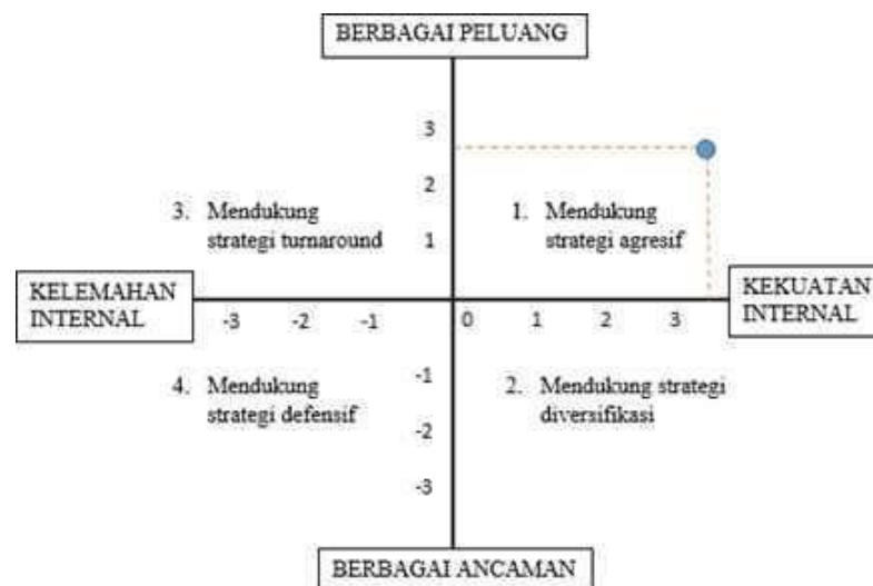
Gambar 1. Diagram SWOT